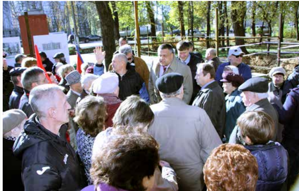
Застройщик (в центре) доказывает собравшимся жителям, что все документы на строительство ресторана комплекса у него в порядке