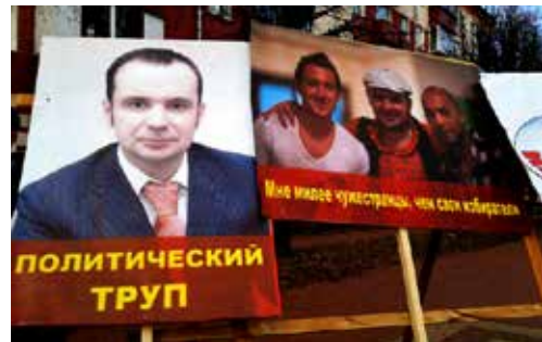
Жители квартала Новский выразили недоверие своему депутату Сергею Дзеглаву