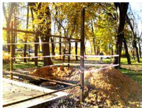
Строительные работы идут прямо у подножья памятника Ленину