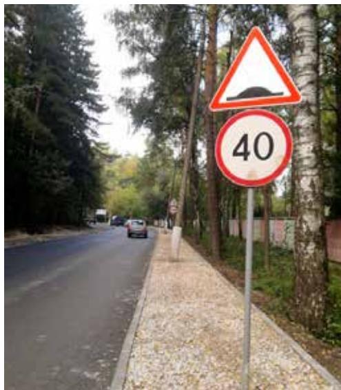
Вероятно, именно это загадочное ТЗ предполагает такое интересное решение — дорожные знаки и мачты освещения прямо посередине пешеходной дорожки