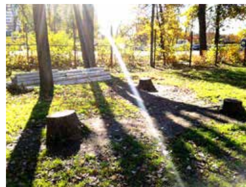
Те самые пенки...

Толпа возмущенно загалдела. Если инвестор был таким прилежным арендатором, прокатилось по толпе, то почему этот участок с 2007 г. находился в безобразном состоянии, а его уборкой занимались работники близлежащих предприятий? Такого