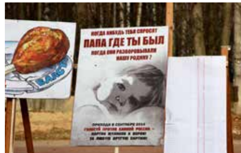
Коммунисты призывают голосовать на очередных выборах за любую другую партию, кроме Единой России