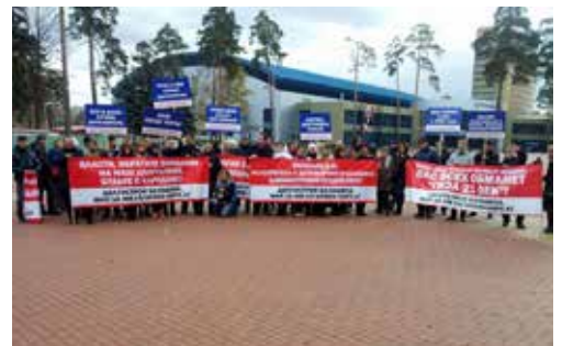
Соинвесторы Гизы XXI век требуют достроить их дома