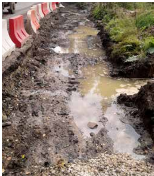
Геннадий Георгиевич выяснил, что работы на шоссе подрядчик выполняет не по проекту, а по некому ТЗ. В котором, например, не предусмотрено устройство системы водотвода