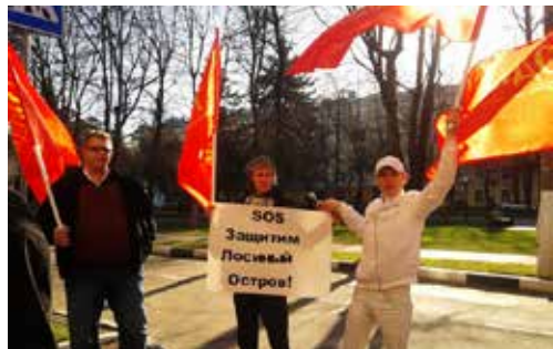
Жители Абрамцево протестуют против застройки Лосино острова