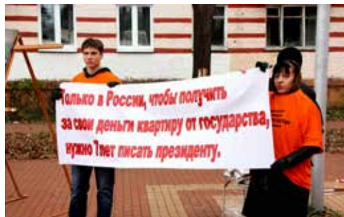
Обманутые дольщики СФК «Реутов» уже не знают, к кому обратиться, чтобы получить заветные квартиры