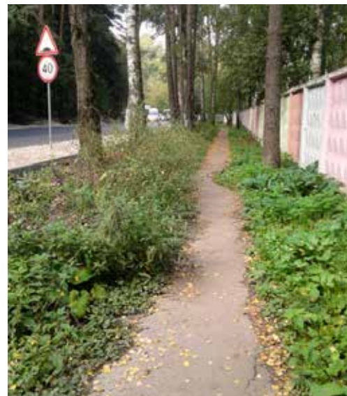
Несмотря на просьбы жителей привести в порядок старую пешеходную дорожку, подрядчик приложил титанические усилия для того, чтобы воткнуть пешеходную дорожку вплотную к проезжей части