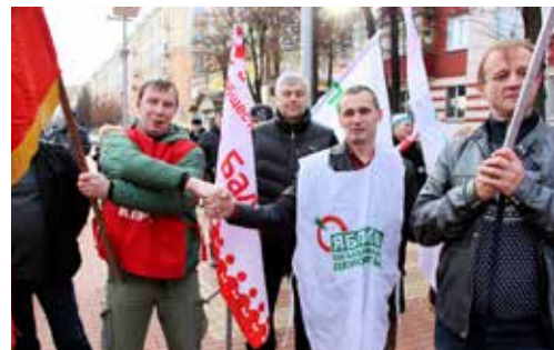
Оппозиционные партии и общественность объединились в борьбе за права рядовых жителей