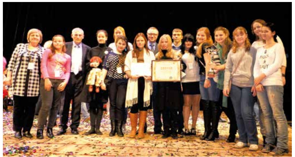
Многолетнюю творческую работу по достоинству оценили