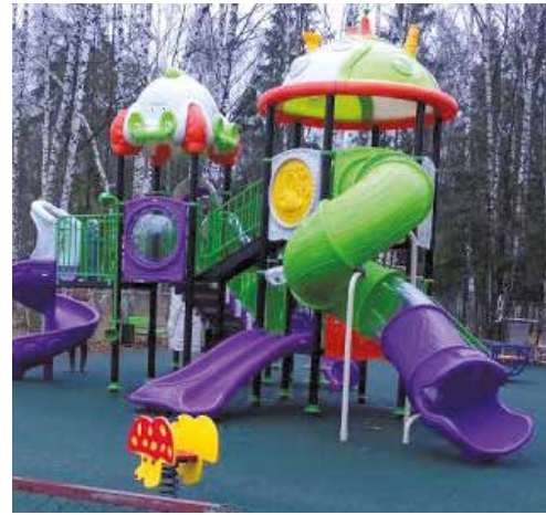
Такой детская площадка была...

«Народный сход», который проходил на фоне сгоревшего детского комплекса, был обставлен со всеми причитающимися ему атрибутами митинга — толпа