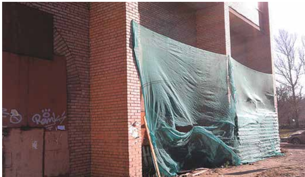
Хотели сделать православную школу, а получается очередной магазин