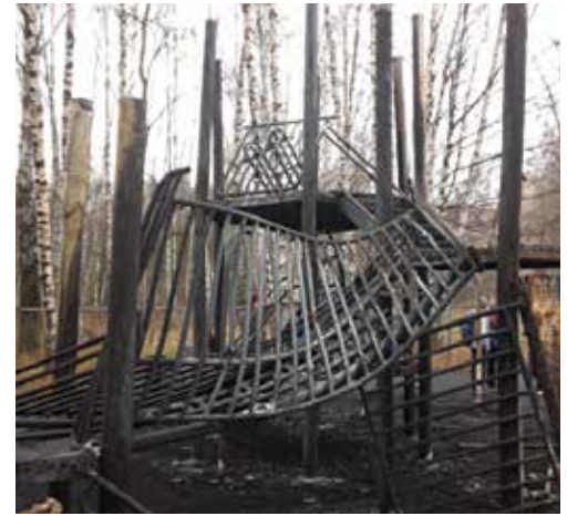
...а такой стала