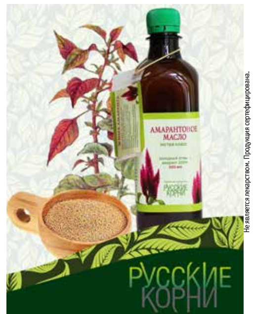
Не является лекарством. Продукция сертифицирована.

Амарантовое масло восстанавливает работу клеток, защищает организм от развития эрозивных процессов, подавляет клетки патогенных микроорганизмов. Нормализует показатели крови и мочи, улучшает функцию почек и печени. Наличие сквалена и витамина Е в составе Амарантового