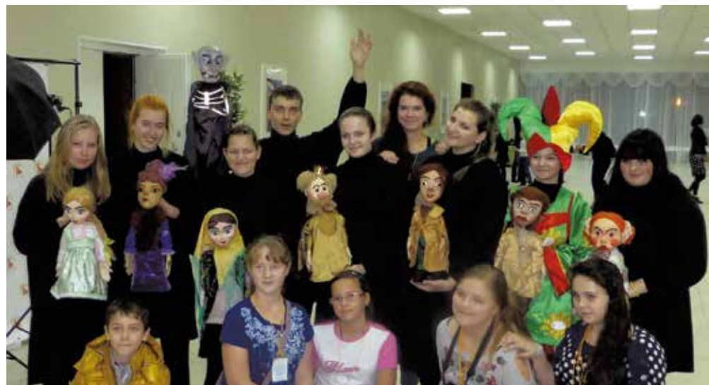
Сплоченный коллектив дружен и за пределами театра